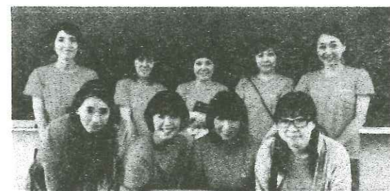
サマーフェスティバル 文化委員担当の皆さん (8/24 第一中学校にて)