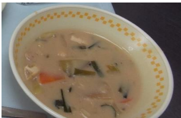
10/1実施 はま菜ちゃんたっぷり野菜の 豆乳みそスープ