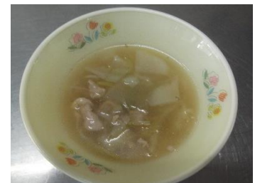
11/18実施 AZUMA風だいこんスープ