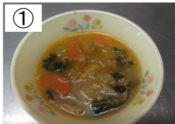
10/30実施 たっぷり野菜のたんたんスープ