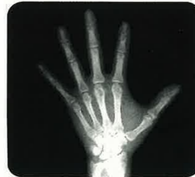
うでや手のほね (レントゲン写真)