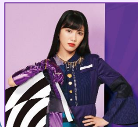
高城 れに さん (ももいろクローバーZ)