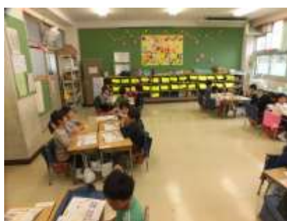
はくを かんじて あそぼう