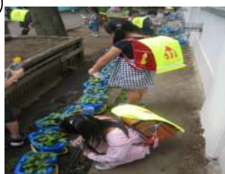
アサガオを育てよう