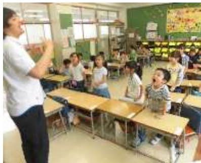
オリベラ先生とあいさつ