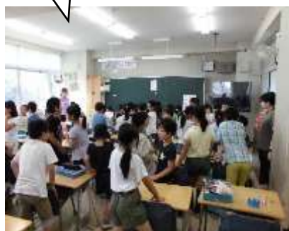
「はなの みち」の音読