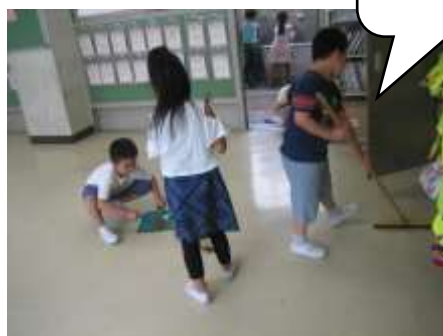
みんなで力を合わせておそうじ