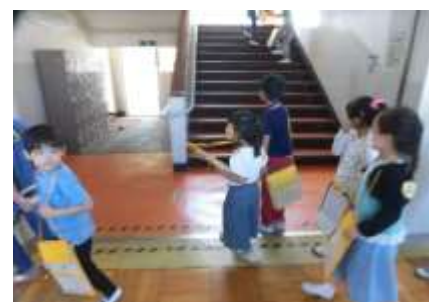
探検バッグを持って学校探検