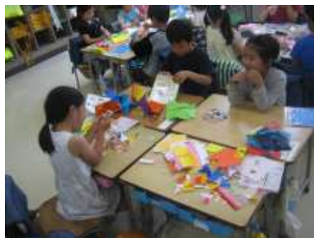
チョッキン パツで かざろう