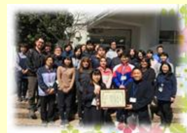
「横浜優秀教育実践校」全職員表彰