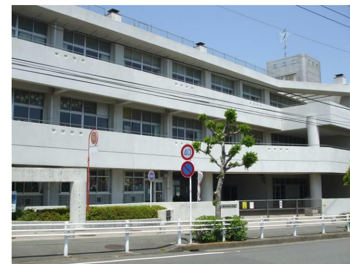
横浜市立釜利谷南小学校

横浜市金沢区釜利谷南4-12-1 TEL 045-782-3630・3670 FAX 045-783-6049