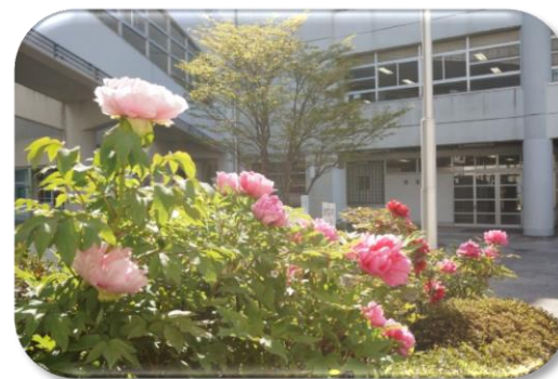
職員玄関脇の区の花「ボタン」