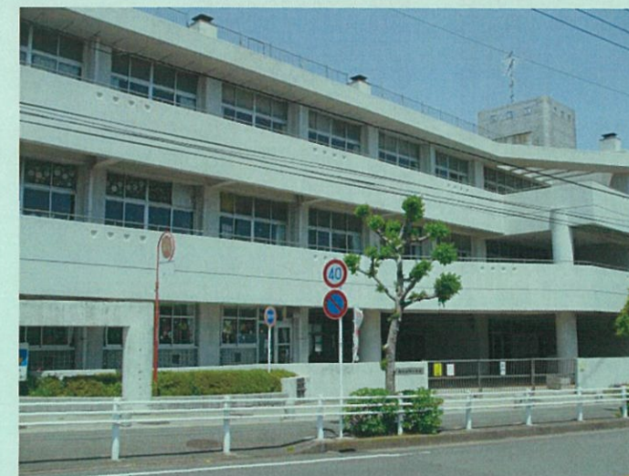
横浜市立釜利谷南小学校