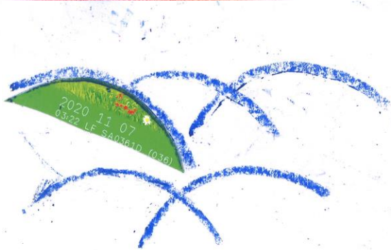
かたがみをきってもようをかく