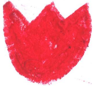
クレヨンでえをかく