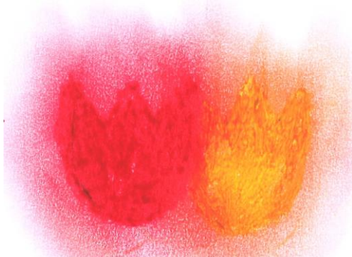
ちがういろどうしをかさねてぬり、ぼかす