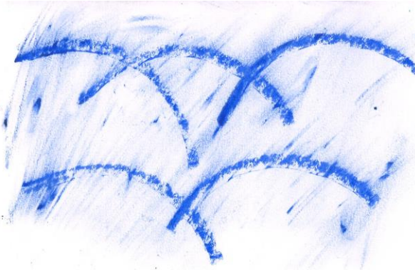
ティッシュでこすってみると・・・こんなかんじに