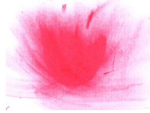
ティッシュペーパーで ぼかす