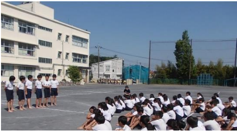
実行委員活動(6年「飛翔」)

運動会に向けて実行委員をつかって取り組んでいる学年がありました。実行委員になった児童は計画を立て、めあてを決めてみんなに伝え、達成できたか見直し、また計画を立て…というように、責任を果たすためにがんばります。まだ実行委員を経験していない児童は、最初、「協力する」ということがよくわからずに、実行委員との「思い」に差