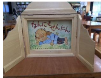
かみしばいぶたい 紙芝居舞台

絵本のまわりに枠をつけることでみんなの目絵に集まりよりお話の世界に入りやすくなります。