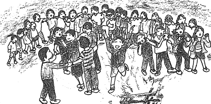
5年生 愛川宿泊体験学習 キャンプファイヤー

5月は、22日(水)に1年生の大池公園への遠足、24日(金)~25日(土)に6年生の日光修学旅行、27日(月)~28日(火)に5年生の愛川への宿泊体験学習と続きました。1年生は小学校での初めての遠足を心待ちにしていた、動物とのふれあい、公園内の探検、アスレチックにジャンボ滑り台、そしてお弁当やお菓子タイムと、何をしても歓声を上げて大喜びといった様子でした。そして6年生の修学旅行は、これ以上は望めないほどの素晴らしいお天気に恵まれ、これ以上はないほどの学年チームワークのよさで、戦場ヶ原での素晴らしい眺望、宿舎での友達との語り、そして平成の大改修を終えたばかりの光輝くような輪王寺、東照宮の見学など、2日間の友達との活動をしっかりと心刻むことができました。さらに5年生の愛川宿泊体験学習は、出発式から帰校式まで、常に「みんな仲よく協力しよう!みんな笑顔でチャレンジしよう!最高の愛川にしよう!」のスローガンが意識されていて、友達と声かけあってグループ活動に取り組む姿が印象的でした。キャンプファイヤーのあの盛り上がりは、みんなが一生覚えている貴重な共通体験になりました。6月には、2年生、3年生、そして4年生の宿泊体験学習と続きます。保護者や地域の皆様に見守られ、そして送り出していただく校外での体験活動で、子どもたちは一回りたくましくなっていく様子です。ここで培われた学級、学年のチームワークをこれからの学校生活に生かしていくようにしたいです。