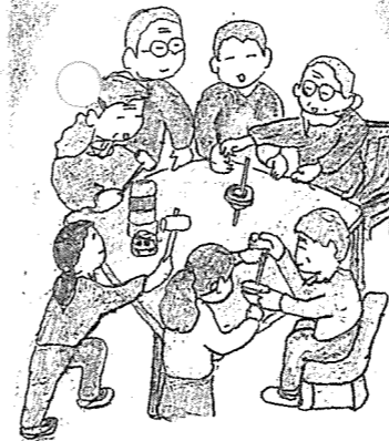
4年生 福祉学習 ケアプラザでの交流活動 豊田地域ケアプラザ利用者の皆さんと昔遊びで交流を深めています。1月もまたお世話になります。