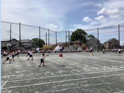
全体練習での応援合戦

いよいよ明日が運動会です。今年も応援団の取組が、学校全体に大きな活気をもたらしています。