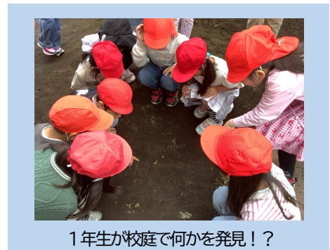
1年生が校庭で何かを発見!?

これからも、子どもたち一人一人の「知りたい」「やってみたい」という思いを大切に、学校目標「共に輝く子」の実現に向けて、主体性を育む教育活動を進めていきたいと思っています。