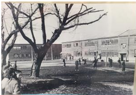
75年くらい前戦争中の校舎

学校には「学校沿革誌」という、歴史を綴った帳面があります。創立記念集会の講話で、全校児童に見せました。向こうが見えそうな薄い和紙に、年度毎にその年の主要な出来事がペンで丁寧に書かれたもので、長い年月で紙の色は茶色く変色していますが、紙はとても丈夫です。それを改めて見てみると、「明治6年6月24日 横濱市立日吉台小学校創立」とあります。「村田駒林金蔵寺に於いて寺子屋教育を施し、名付けて清林学舎と称したり」という記述から、お寺で近所の子どもが学んだ場所、「寺子屋」が日吉台小学校の元であったことがわかります。学校の名前は「清林学舎」から変わり、「駒林」と名のつく小学校であった時代が昭和7年まで続きます。日吉台小学校は日吉村の「駒林」という地名の場所に存在していたのです。川崎