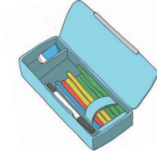
基本の筆箱の中身