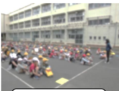
1・2年生が集まり、さあ!出発式です。

これからも、1年生と2年生で関わりながら、お互いにたくさんのことを学べるよう活動していきます。