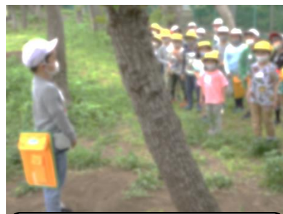
モンチッチひろばで、場所の紹介や説明をする2年生。