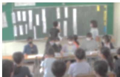
第1回代表委員会のようす。

代表委員会は、各クラスの代表委員・各委員会の委員長・運営委員が集まり、議題に沿って話し合う活動です。第1回の議題は「よりよい学校をつくるために年間計画を立てよう」でした。昨年度から継続している児童会スローガン「つなげよう あいさついっぱいともだちいっぱい えがおのわ」に近付くために、全校でどのような活動を行っていき