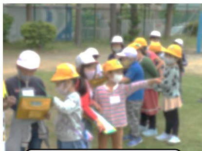
1年生の疑問に応じる2年生。