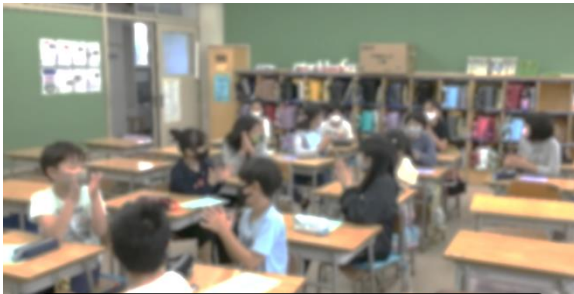
自己紹介でみんなのことを知りました。

クラブ活動は、異学年の児童が集まり、4・5・6年生それぞれの学年に応じた目標に向かいながら、共通の興味や関心を追求する活動を行います。6年生のリーダーシップのもと、多くの友達と交流し、今できる活動を創っていきます。