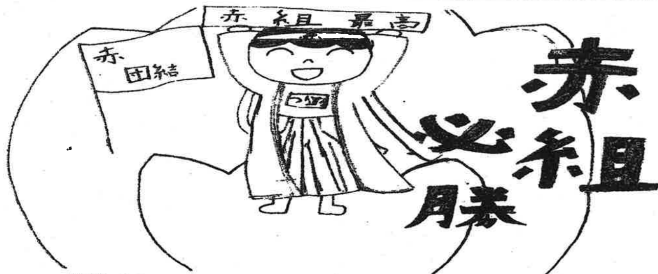
赤組イメージキャラクター < つながる応援団長 >