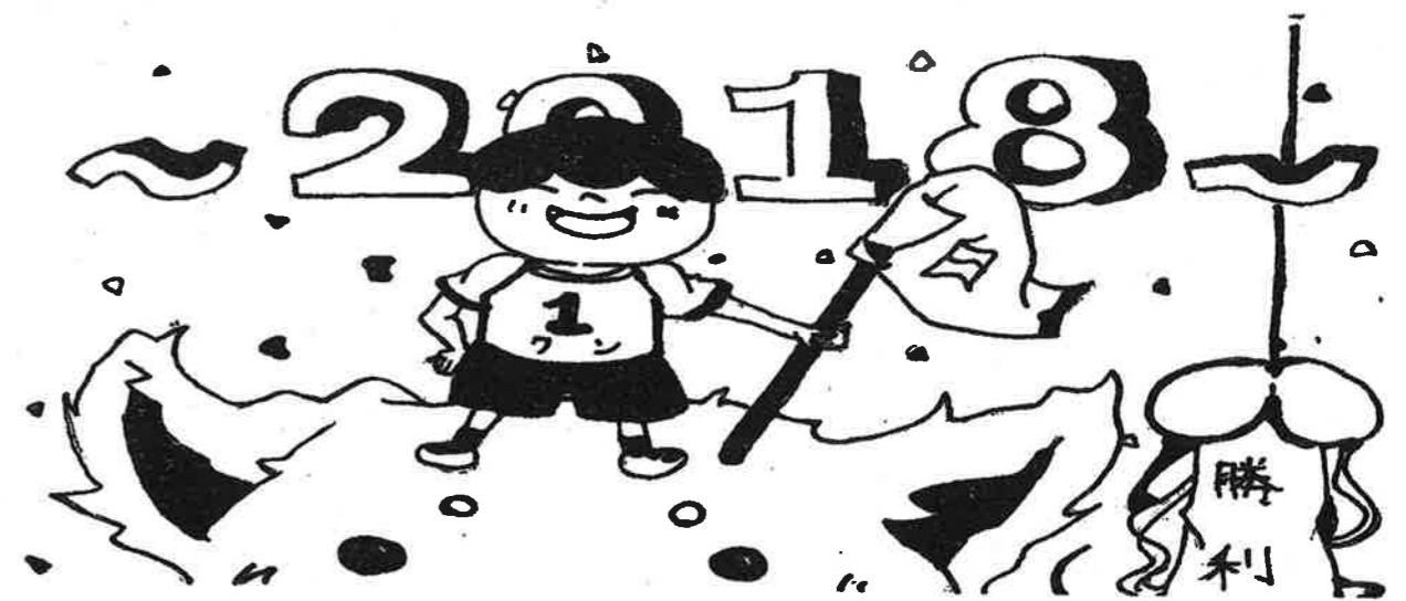
白組イメージキャラクター < 勝利のつながるくん ~犬~ >