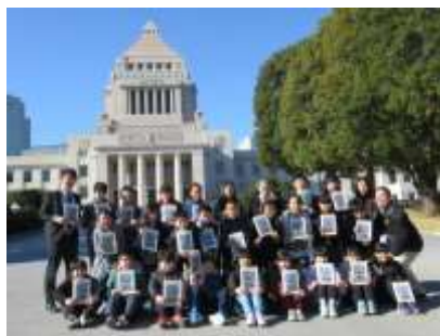
【国会議事堂前にて】

6年生は1月17日（火）に小学校生活最後の校外学習である東京見学に出かけました。晴天に恵まれ、バスの中から見ると富士山は最高の眺めでした。午前中は国会議事堂・参議院を訪ね、本会議場や中央広間、天皇陛下の御休所などを見学しました。厳かな雰囲気の中、学習したことを確認することができ、深い学びにつながりました。午後は江戸東京博物館を訪れ、江戸時代から現代・東京までの町の様子や時代ごとの文化の移り変わり、庶民の生活の様子などを知ることができました。最後の校外学習となりましたが、思い出に残る東京見学となりました。