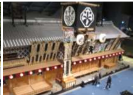
【江戸東京博物館にて】