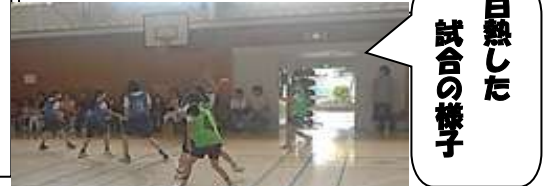
白熱した試合の様子

7月2日(土)に朝の特別バスケットボールクラブのメンバーが、六つ川西小学校を本校に招き、交流試合を行いました。お互いに練習してきたことを試合で実践したり、全力で応援し合ったりと「交流」にふさわしい雰囲気、試合を楽しみました。