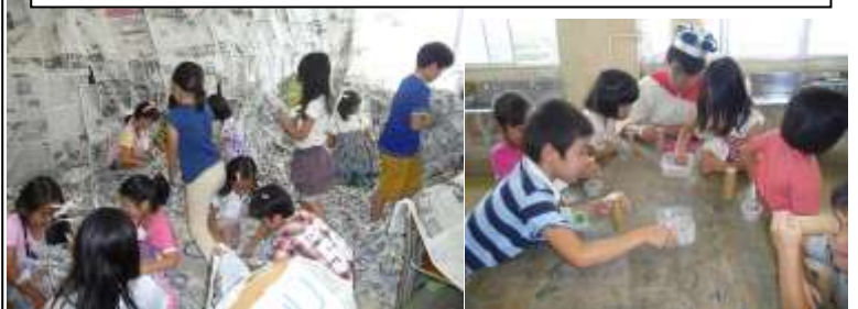
国大生と楽しく活動している様子 (わくわくサタデー)

7月16日(土)、わくわくサタデーが開かれました。約90名の大学生が来校し、様々な内容の活動を催してくれました。本校からは170名の児童が、『鏡の魔法にかけられて(万華鏡作り)』、『ニンジャになるニンジャ!(ウォークラリー)』、『わくわく協奏曲(身近なもので演奏)』、『アリスインモノトーンランド(新聞紙で遊ぶ)』、『いたずら小人の巨大すごろく(巨大なすごろく)』の5つのグループに分かれて参加しました。どのグループでも、遊び方を大学生に優しく教えてもらいながら、わくわく楽しい時間を過ごしていました。