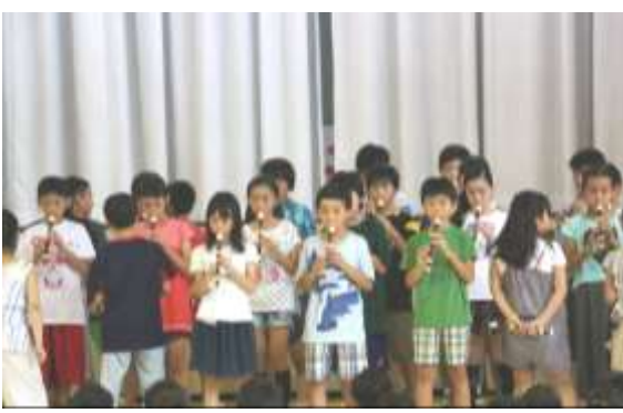
『小さな世界』を演奏している5年生♪

<各学年の感想> ♪♪♪♪ ♪♪♪♪ ♪♪♪♪ ♪♪♪♪ ♪♪♪♪ ♪♪♪♪ ♪♪♪♪ ♪♪♪♪ 「後ろを振り向いた時、何が始まるのかワクワクして見た。」 「一生懸命歌う表情が素敵でした!」「5年生のようにリコーダーを上手く吹いてみたいな。」 「打楽器がたくさんあって面白かったな!」