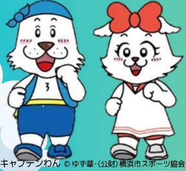
キャプテンわん © ゆず華・(公財)横浜市スポーツ協会