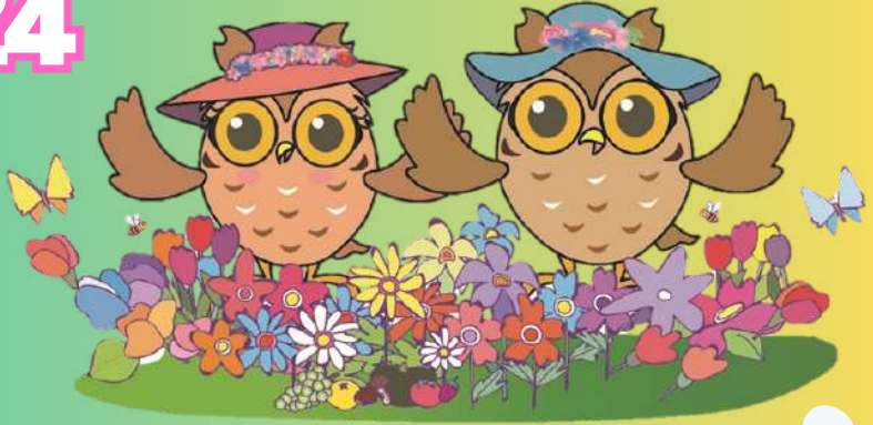
瀬谷区マスコットキャラクター セヤまる