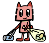
公園愛護会マスコット あいごぼん

身近な公園や水辺で愛護会の皆さんとともに活動体験です。主に小学生を対象としています。