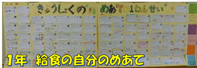
1年 給食の自分のめあて