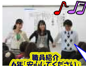
職員紹介 6年!安心して下さい!

学校説明会・PTA総会へのご参加、ありがとうございました。今年度の学校経営の方針や重点取組、学力向上への取組などをお話しさせていただきました。この日は参加された方からご意見やご質問をお受けする時間をもつことができずでしたので、なにかお気づきのことがありましたら、学校までお寄せください。