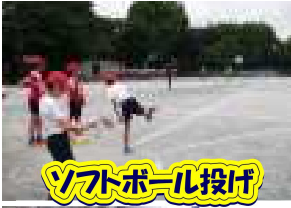
ソフトボール投げ