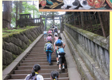
「眠り猫」が守る「坂下門」を抜け207段の階段を上り家康のお墓の「奥宮」へ。疲れましたが、上ったかえがありました。