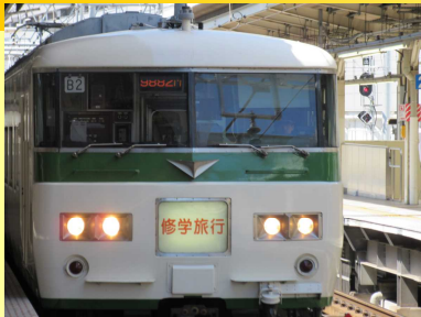
修学旅行専用列車が横浜駅に入線するとテンションはマックス！さあ出発！列車の中でのおやつや、トランプなどのレクは特別に楽しかったです。