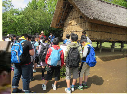
弥生時代の高床式倉庫の説明を、熱心に聞いています。