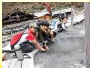
奥日光は肌寒く、標高の高さを実感しました。湯元温泉の源泉に10円玉を入れて色の変化を楽しんだり、足湯に入ったりして温泉を味わいました。