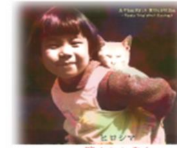
ヒロシマ消えたかぞく 指田 和 ポプラ社