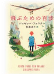
飛ぶための百歩 ジュゼッパ・フェスタ 岩崎書店