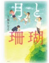
月と珊瑚 上條 さなえ 講談社