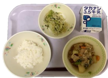
4月15日（水） 生揚げのそばろ煮の献立