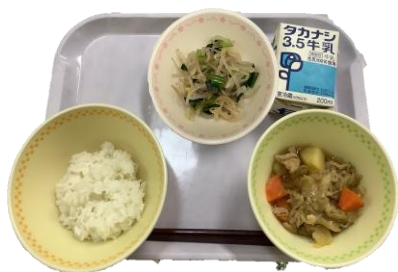
4月13日（月） 肉じゃがの献立