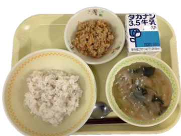
4月14日（火） ツナそばろの献立