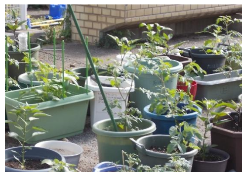
初夏の光を浴びて、二年生の夏野菜ぐんぐん育っています

学校においても、これからも地域の方々とのつながりを大切にしながら、子ども達が人との関わりの中で学び、思いやりや感謝の気持ちを育ていけるよう努めてまいります。引き続き、皆様のご理解とご協力をどうぞよろしくお願いいたします。