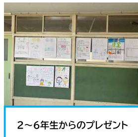
2～6年生からのプレゼント

1年生は青木での生活が始まって15日ほどですが、「～したい」の意欲にあふれています。自前の「わくわくめがね」「楽しいめがね」をつくり、校内の「はてな」さがしに一生懸命な子、「校長先生、みつけたよ」、「校庭から無事に戻ってきてちゃんと並んでます！」と校長室に報告に来てくれる子、また日々の教師のしかけに気付き、次のわくわくにつなげている子どもたちの姿を見守る担任たちと、毎日がドラマにあふれています。