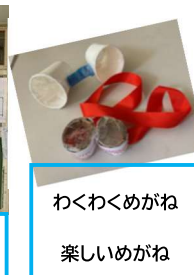
わくわくめがね 楽しいめがね