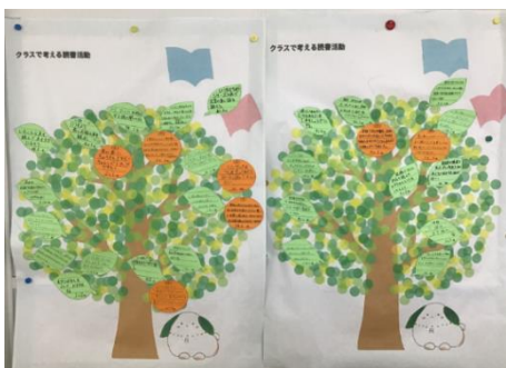
クラスの取り組み

☆ミニビブリオバトル会 ⇒3～6年生の有志が、発表形式でお勧めしたい本の紹介をし、チャンプ本を選びました(全7回)。