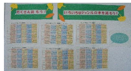
↑ クラス別貸出冊数調べ

給食の時間を使ってテレビで紹介したり、ポスターを作ったりして本を展示しました。本が次々と貸し出されました。