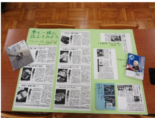
6年国語「平和について考える」参考資料

5年生…国語「天気を予想する」ではグラフや表を使って意見文を書きました。社会「農業」「水産業」では調べ学習、「情報」では御嶽山噴火のニュースを基にメディアの比較を行いました。新聞や雑誌を実際に手に取ってみることで、違いを実感したようです。