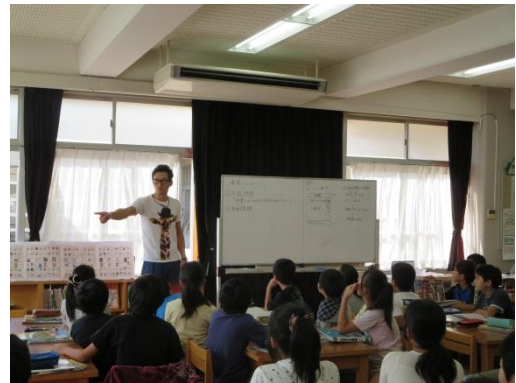
5年社会「水産業」授業風景

図書館が緑園東小学校の子どもたちの居心地のよい空間であり、知的好奇心の満たされる場になるよう、努めていきたいと思えます。