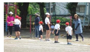
上学年がアドバイス