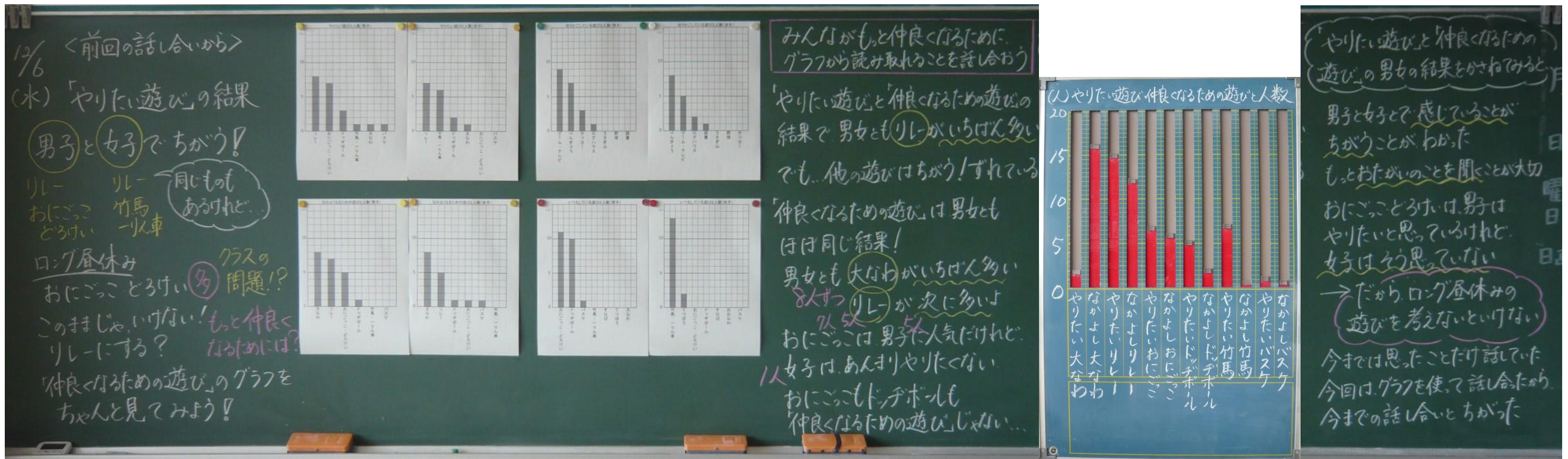
問題(Problem) 計画(Plan) データ(Data) 分析(Analysis) 結論(Conclusion)