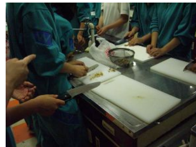
根を良く洗って細かく刻んでおきます。