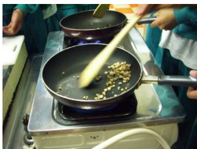
刻んだ根を乾煎りします。