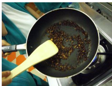
だんだん色が付いてきました。 コーヒーと同様にいれてみます。