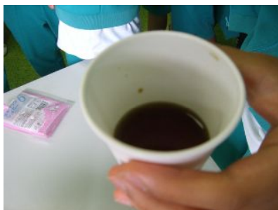
やっと完成しました。

どうでしょう。見た目はなかなかの出来映えです。お味の方はいかがでしょうか。試飲した感想では、 あさいり 浅煎りの香りが良かったということです。