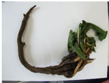
タンポポの根は立派です。