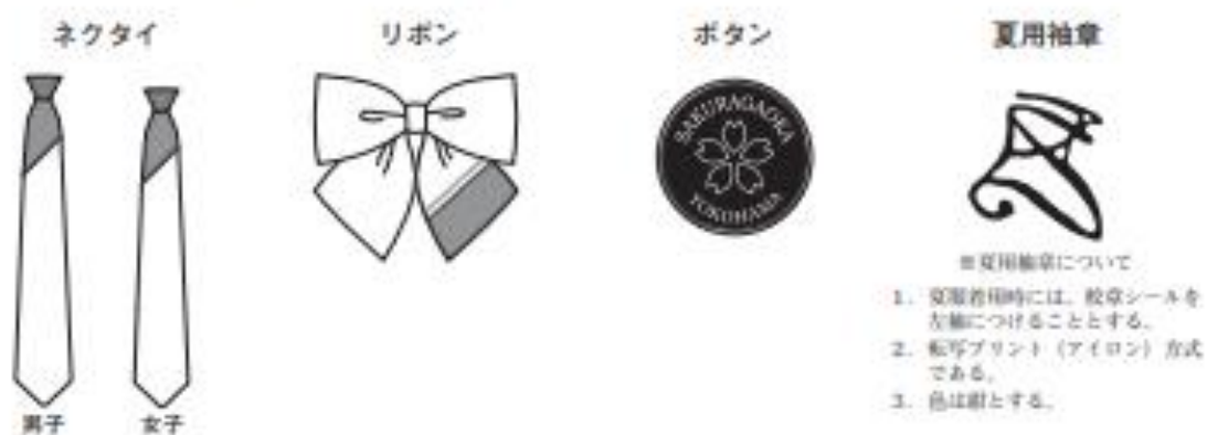
図 ネクタイ、リボン、ボタン、夏用袖章、制服