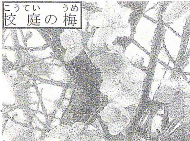
しやうがっこう ちいき とも あゆ 小学校が地域と共に歩んできたことが分かります。