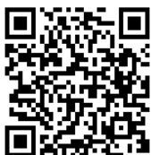
ホームページQRコード