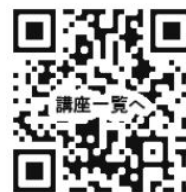
講座申込みQRコード