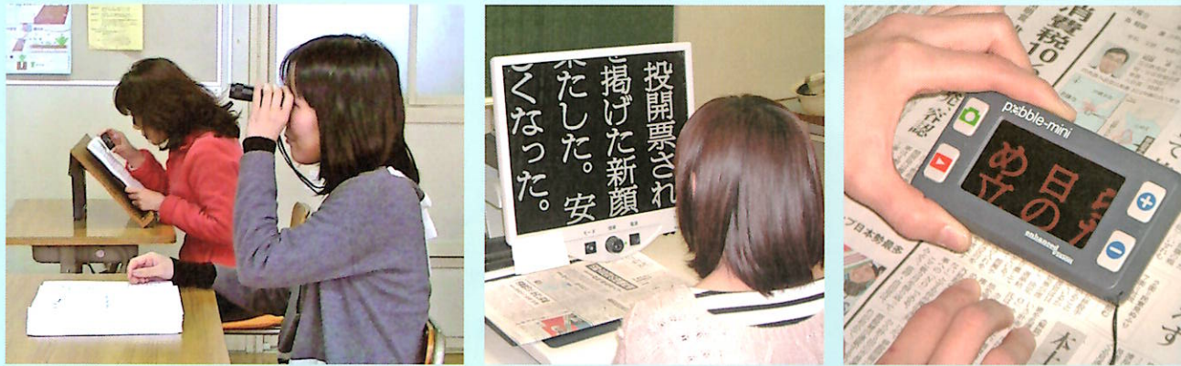
奥：書見台・ルーペ 手前：単眼鏡