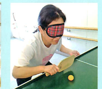
サウンドテーブルテニス部