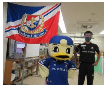
10月13日(木) 横浜F・マリノス サッカー教室

やってみたら楽しかった、といったことも多いと思います。10月13日、横浜F・マリノスの「もちもちコーチ」と「マリノスケ」が福浦院内学級に来校、福浦からの発信でサッカー教室が開催されました。教え方が上手ということもあると思いますが、短い時間ながら参加した子どもたち、とても楽しく過ごすことができました。