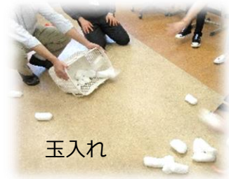
めざせハイスコア

教室での授業の様子です。限られたスペースで体育の授業もしています。今回は玉入れ・玉投げに取り組みました。点数を競って楽しくも真剣に活動しました。