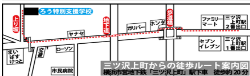
三ツ沢上町からの徒歩ルート案内図 横浜市営地下鉄「三ツ沢上町」駅下車 徒歩約20分