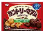
カントリーマアム