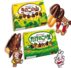
きのこの山 たけのこの里