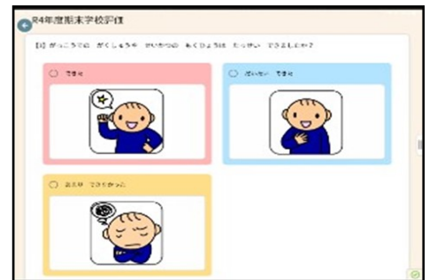
図 アンケート(ロイロノート版)

質問は5問。例えば、こんな質問です。「学校での学習や生活の目標は達成できましたか。」「自分らしい伝え方、例えば、言葉や表情、視線、発声、ジェスチャー、タブレットの活用等でコミュニケーションができましたか。」「タブレットの活用やロイロノートでの学習等ができましたか。」概ねどの質問にも「できた」「だいたいできた」(約9割)と回答していました。記述式の感想では、「じりつ活動が楽しくて、毎日やりたいです」「学校がたのしかったです。理由は友達とすごせたから。」「修学旅行に行けてよかったです。」等、充実した学校生活を読み取れる内容が多かったです。