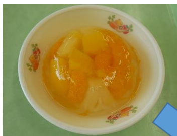
スペシャル仕様のゼリー