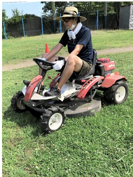
草刈り機で一気に