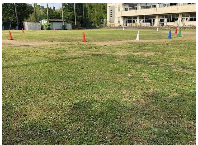
きれいに刈りそろえました