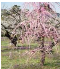
しだれ梅 イメージ