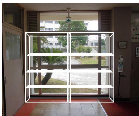
ショーケース設置イメージ

洋一中同窓会の皆様のご協力で、正門付近への記念植樹と正面玄関のショーケースの設置を行います。どちらも、洋一中の新たな「顔」となることでしょう。