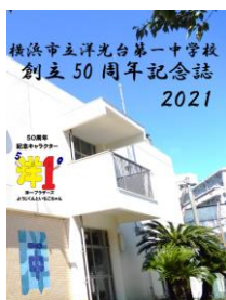
リーフレット表紙

8ページカラーで 洋一中の50年を振り 返り、これまでの歩み の記録として残すもの となっています。