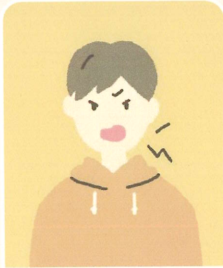
怒りやすくなった